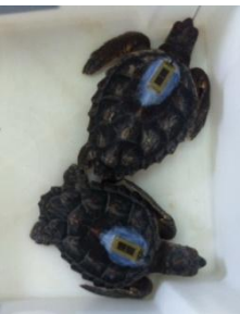
Fig. 1. Neonato con transmisor

La Universidad de Florida Central, el Proyecto TAMAR ( www.tamar.org.br ) y el Centro de Ciencias Pesqueras de las Islas en el Pacífico del Servicio Marino de Ciencias Pesqueras de la NOAA están trabajando conjuntamente para entender el comportamiento migratorio y los patrones de dispersión de las tortugas Caguamas ( Caretta caretta ) durante su etapa marina en el Océano Atlántico Sur. Se señalaron diecinueve neonatos, usando transmisores satelitales modificados de baja escala y de carga con energía solar (Figura 1). Las tortugas fueron criadas en el laboratorio de 4-13 meses, 10.8-26.8 cm (LRC) y 235-2800 gramos.