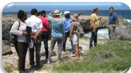
Visita de Campo en Curaçao

Para operar este programa se identificó un equipo compuesto por un coordinador de campo y dos recolectores de datos. Los recolectores de datos recibirán capacitación en identificación de especies, nidos, rastros y almacenamiento de datos en Barbados. Una vez culminada la capacitación, la STCB continuará la capacitación en Curaçao para construir capacidades locales con los guardaparques, representantes del Gobierno y ONG's ambientales locales. El análisis de los datos se realizará con el apoyo de Carmabi y sus resultados será incluidos en el Reporte Anual de la CIT.